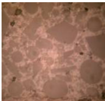
A : 旧世代 : 汎用樹脂断面 →粉砕した角のある形状が目立つ