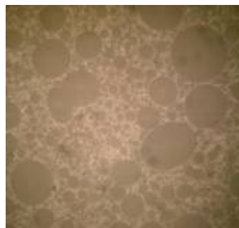
B : 低応力樹脂 →充填材の形状が球状