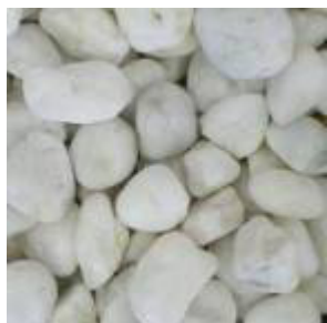
<よく転がっている石><実体顕微鏡観察>